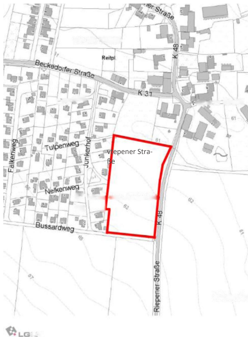
Abb.: Übersichtsplan ohne Maßstab